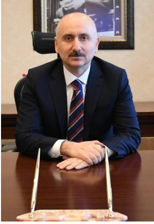
Adil KARAİSMALOĞLU Ulaştırma ve Altyapı Bakanı

Ülkemize ve vatandaşlarımıza layık oldukları nitelikte hizmet götürmek, gençlerimiz ve çocuklarımıza hak ettikleri bir gelecek bırakmak hepimizin en büyük arzusudur. Bu bakış açısıyla, gece gündüz demeden, işçimizle, mühendisimizle, teknisyenimizle var gücümüzle çalışıyoruz. Beklediğimiz yegâne ödül, ulaşım imkânlarımız sayesinde, işe, aşa, sevdiklerine ve daha iyi bir yaşama kavuşan insanımızın mutluluğudur, hayır duasıdır. Ülkemizi daha büyük, daha zengin, daha gelişmiş bir ülke haline getirmek ve dünyanın lider ekonomilerinden biri olarak görmek ise hepimizin ortak hayalidir.